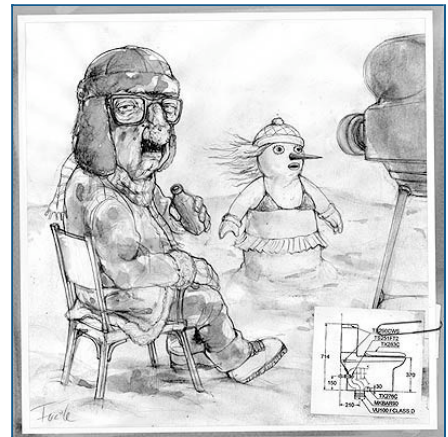
El cineasta Miroslav Macarevich