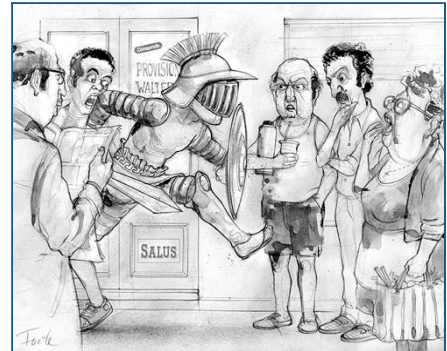
Washington Carreras vestido de gladiador